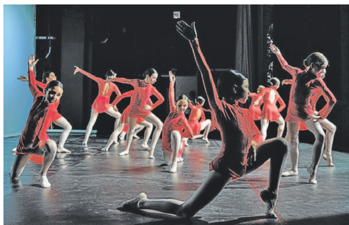
Concurso de danza en la Sala BBK, epicentro cultural de la fundación bancaria. IGNACIO PÉREZ

Otro proyecto destacado en el ámbito universitario es el concurso de robótica Sener-CEA's Bot Talent. En él, equipos de estudiantes de últimos cursos de grado o máster aplican sus conocimientos para resolver problemas reales de guiado, navegación y control de vehículos autónomos.