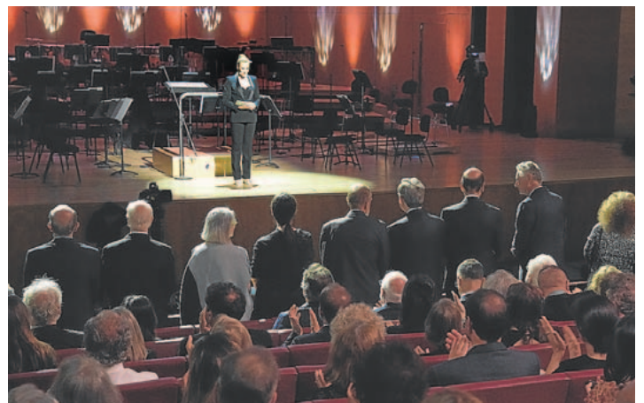
Concierto de los Premios Fronteras del Conocimiento, una de las apuestas de BBVA.

En el terreno internacional, Tubacex mantiene alianzas puntuales con UNICEF para intervenir en zonas vulnerables próximas a sus operaciones. Entre ellas, impulsar la educación de más de 7.000 niños en Guyana y Surinam, promoviendo entornos educativos seguros y saludable. Proyectos similares se han desarrollado en otros lugares, como la frontera entre Birmania y Tailandia.