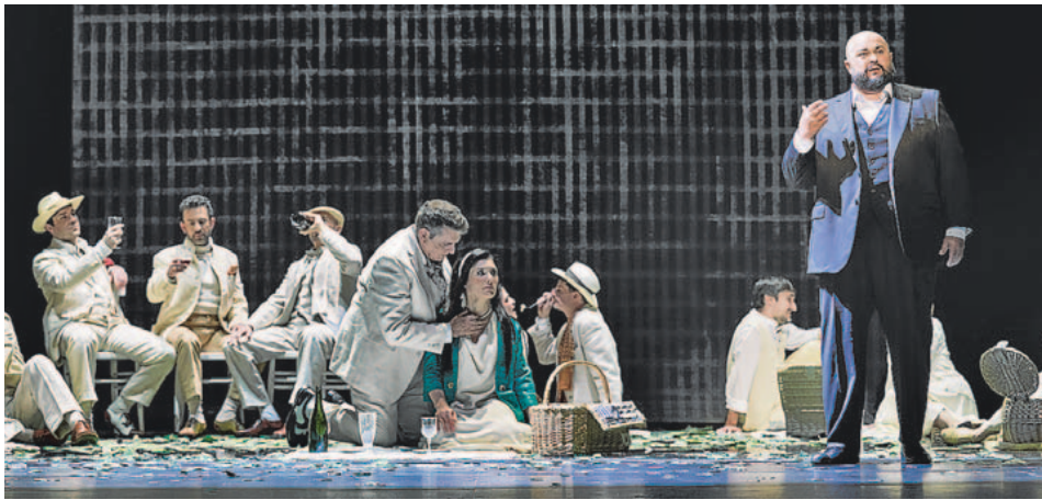
La ABAO es uno de los hitos culturales de Bizkaia que no existirían sin el apoyo de fundaciones. E. MORENO ESGUIBEL