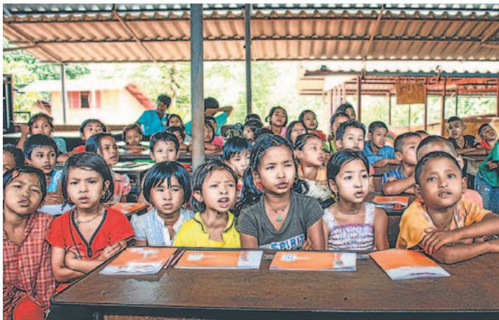
Proyecto escolar de la Fundación Tubacex en Tailandia.

Euskadi tiene también un componente particular que refuerza la implantación de las fundaciones: la vocación filantrópica y cultural del empresariado vasco, que históricamente ha ejercido de mecenas e impulsor del arte o la literatura. Una tradición que viene del siglo XIX. Basta citar el nombre de la familia de la Sota y su influencia en la cultura del País Vasco, o del magnate Horacio Echevarrieta a principios del siglo XX. Así, las fundaciones de la actualidad son herederas de la raigambre filantrópica del pasado.